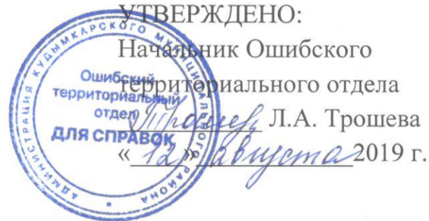
График вывоза ТКО Ошибская территория Кудымкарского муниципального района